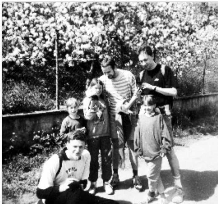
Studená desítka lepší teplé dvanáctky

Vážení hostinští, buďte tak hodní a tomuto opilci zapište do vybraného okénka jméno své hospůdky (může být i razítko) a počet vypitých piv. Pokud zapíšete i čas, ušetříte nás spousty pozdějších nesrovnalostí, které plynou z nedostatku mozkových buněk, protože se v ranních hodinách nejsme schopni upamatovat, kde a kdy jsme předešlý den byli a co jsme tam dělali. 1)